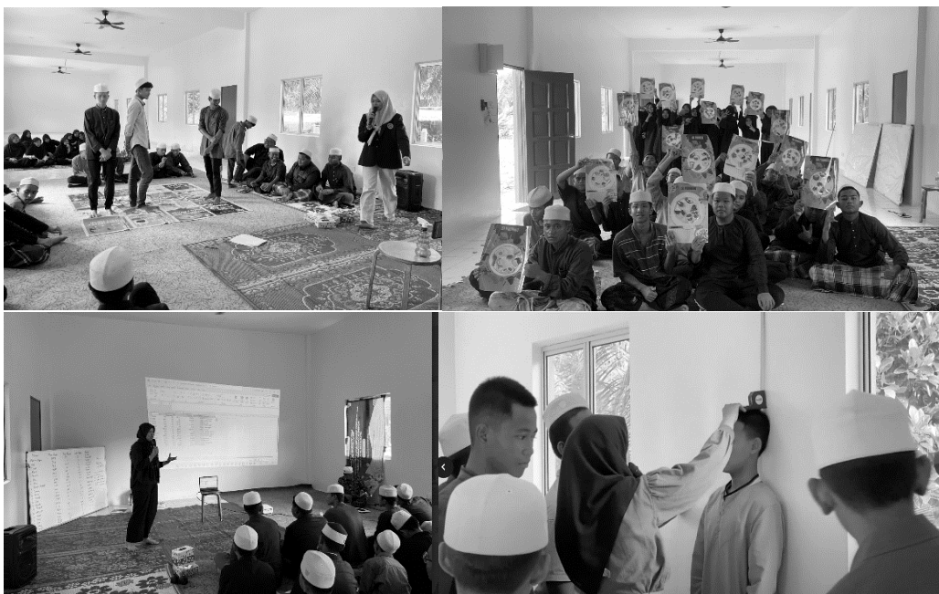
Gambar 3. Proses kegiatan permainan ular tangga, isi piringku, dan pengukuran IMT

Selanjutnya merupakan penyampaian materi mengenai Citra Tubuh. Pada masa remaja, citra tubuh merupakan salah satu hal yang dapat menyebabkan masalah kesehatan baik dalam segi fisik maupun psikologis. Remaja yang tidak puas dengan kondisi atau penampilan tubuh mereka cenderung rentan mengalami depresi, stres dan gangguan makan (Purnama, 2018). Selain itu ketidakpuasan remaja terhadap fisik mereka juga dapat membuat mereka melakukan diet ekstrem atau diet yang tidak sehat sehingga dapat mempengaruhi kesehatan fisik mereka (Wati, et al., 2021). Terdapat beberapa strategi yang dapat dilakukan untuk meningkatkan citra tubuh positif pada remaja seperti edukasi gizi dan kesehatan, pengembangan kepercayaan diri dan dukungan sosial dari lingkungan sekitarnya (Abdillah et al., 2023; Fauziah et al., 2021). Materi mengenai Citra Tubuh ini disampaikan agar siswa lebih merasa peduli tentang penampilan diri dan kesehatan, memahami kelebihan, menerima kekurangan, dan mengeluarkan potensi diri. Kegiatan juga ditambah dengan permainan isi piringku. Disini siswa dilatih untuk memahami materi tentang gizi seimbang dan contoh penerapannya. Siswa diberikan kesempatan untuk mengatur isi piringnya dari berbagai pilihan sumber makanan. Selain itu, siswa juga diminta presentasi didepan agar melatih rasa percaya dirinya. Kegiatan diakhiri dengan mengisi soal posttest .