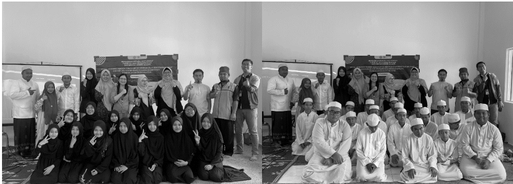
Gambar 2. Pembukaan kegiatan yang dihadiri oleh Kepala Sekolah dan Guru Sekolah Indonesia Kuala Lumpur

Kegiatan pengabdian masyarakat berupa peningkatan pengetahuan terhadap gizi remaja ini dilaksanakan dalam dua hari yaitu Sabtu, 26 Agustus 2023 dan Minggu, 27 Agustus 2023 yang berlokasi di Sanggar Bimbingan SMP An-Nahdloh Tanjung Sepat, Selangor, Malaysia. Kegiatan juga dihadiri oleh Kepala Sekolah Indonesia Kuala Lumpur (SIKL) dan Guru SIKL.