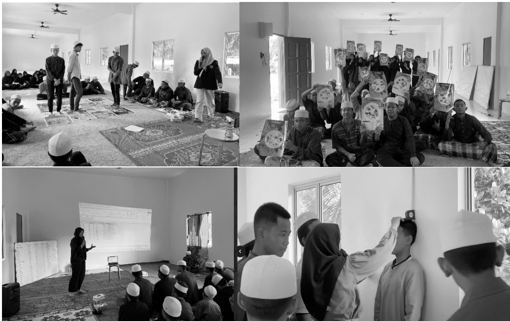
Gambar 3. Proses kegiatan permainan ular tangga, isi piringku, dan pengukuran IMT

Selanjutnya merupakan penyampaian materi mengenai Citra Tubuh. Pada masa remaja, citra tubuh merupakan salah satu hal yang dapat menyebabkan masalah kesehatan baik dalam segi fisik maupun psikologis. Remaja yang tidak puas dengan kondisi atau penampilan tubuh mereka cenderung rentan mengalami depresi, stres dan gangguan makan (Purnama, 2018). Selain itu ketidakpuasan remaja terhadap fisik mereka juga dapat membuat mereka melakukan diet ekstrem atau diet yang tidak sehat sehingga dapat mempengaruhi kesehatan fisik mereka (Wati, et al., 2021). Terdapat beberapa strategi yang dapat dilakukan untuk meningkatkan citra tubuh positif pada remaja seperti edukasi gizi dan kesehatan, pengembangan kepercayaan diri dan dukungan sosial dari lingkungan sekitarnya (Abdillah et al., 2023; Fauziah et al., 2021). Materi mengenai Citra Tubuh ini disampaikan agar siswa lebih merasa peduli tentang penampilan diri dan kesehatan, memahami kelebihan, menerima kekurangan, dan mengeluarkan potensi diri. Kegiatan juga ditambah dengan permainan isi piringku. Disini siswa dilatih untuk memahami materi tentang gizi seimbang dan contoh penerapannya. Siswa diberikan kesempatan untuk mengatur isi piringnya dari berbagai pilihan sumber makanan. Selain itu, siswa juga diminta presentasi didepan agar melatih rasa percaya dirinya. Kegiatan diakhiri dengan mengisi soal posttest .