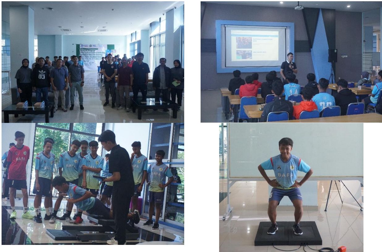
Gambar 1. Dokumentasi Rangkaian Kegiatan

Untuk mengetahui ada tidaknya perbedaan pengetahuan/pemahaman antara sebelum diberi pemaparan materi dengan sesudah diberi materi maka perlu dilakukan uji beda dengan menggunakan Paired T-Test. Hasil Uji beda dapat dilihat pada Tabel 3.