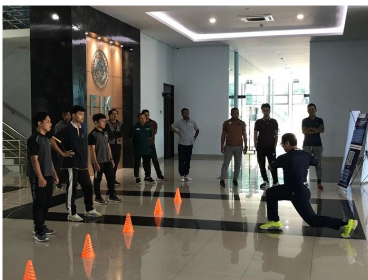
Gambar 3. Simulasi Latihan Fisik di Ruang Terbuka

Lebih lanjut, ia memimpin simulasi praktek dalam tiga tahap. Tahap pertama dilakukan di ruang terbuka (Gambar 3), tahap kedua di laboratorium fisik (Gambar 4), dan tahap ketiga di lapangan sepak bola (Gambar 5).