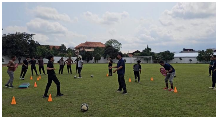
Gambar 5. Simulasi Circuit Training

Simulasi latihan beban menambah wawasan bagi para pelatih, pasalnya mereka tidak pernah memberikan program latihan beban kepada pesepak bola. Lebih lanjut, pemateri mensimulasikan circuit training di lapangan sepak bola. Ada 6 pos dalam circuit training tersebut yang mengandung unsur latihan beban internal, latihan beban eksternal, dan latihan teknik di sepak bola.