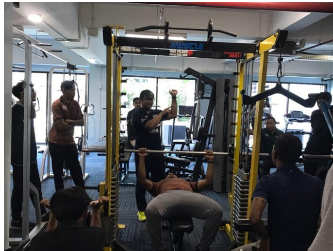
Gambar 4. Simulasi Latihan Beban

Simulasi latihan beban menambah wawasan bagi para pelatih, pasalnya mereka tidak pernah memberikan program latihan beban kepada pesepak bola. Lebih lanjut, pemateri mensimulasikan circuit training di lapangan sepak bola. Ada 6 pos dalam circuit training tersebut yang mengandung unsur latihan beban internal, latihan beban eksternal, dan latihan teknik di sepak bola.