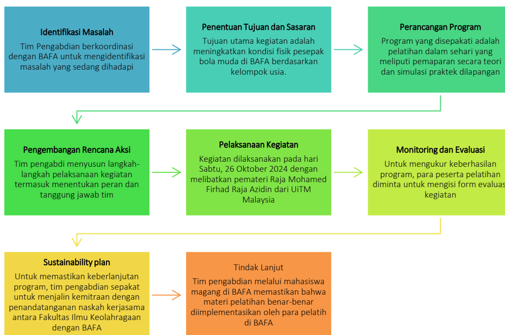
Gambar 1. Tahapan kegiatan Pengabdian pada Masyarakat

Seperti yang diilustrasikan pada Gambar 1 , program pengabdian masyarakat ini dilakukan dalam delapan tahap. Untuk mengukur keberhasilan kegiatan pengabdian pada masyarakat, tim peneliti memberikan form evaluasi kegiatan kepada para peserta pada saat sebelum dimulai kegiatan dan sesudah kegiatan. Harapannya, para peserta mendapatkan manfaat dari kegiatan, kegiatan benar-benar tepat sasaran, dan sebagai dasar untuk memperbaiki kegiatan untuk kegiatan di masa mendatang.