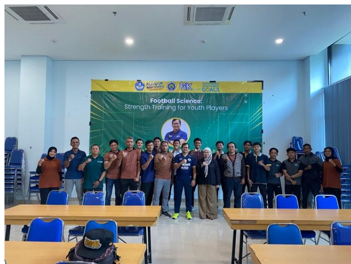
Gambar 6. Foto Bersama